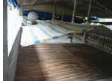
Hình 4: Chuẩn bị ô úm cho heo con

Chú ý cần có bạt che chắn gió cho heo vào ban đêm cũng như lúc mưa gió, mép trên của bạt che cần có khoảng hở so với mái chuồng là 0.5 m để tạo sự thông thoáng trong trại.