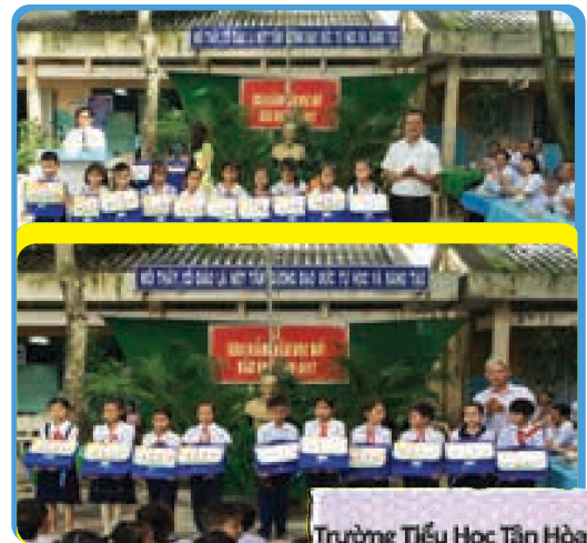
Trường Tiểu Học Tân Hòa 2 Gò Công Đông – Tiền Giang