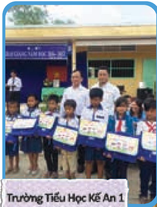
Trường Tiểu Học Kế An 1 Kế Sách – Sóc Trăng

Sau đây là một số hình ảnh của chuỗi chương trình tặng quà cho các em học sinh có thành tích học tập tốt: