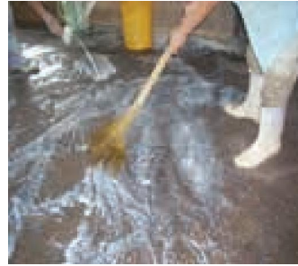
Hình 2: Phun sát trùng trại heo sau khi làm vệ sinh cơ học Hình 3: Quét vôi (20%) nền và tường ô chuồng nuôi heo