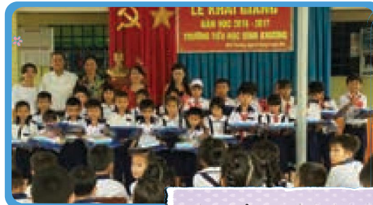
Trường Tiểu Học Bình Khương Chợ Gạo – Tiền Giang