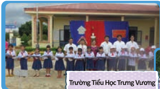
Trường Tiểu Học Trưng Vương Ea Kar – Đắk Lắk