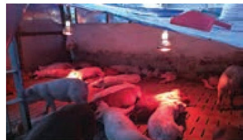
Hình 6: Úm heo con đủ nhiệt độ heo con nằm đều trong khu vực úm